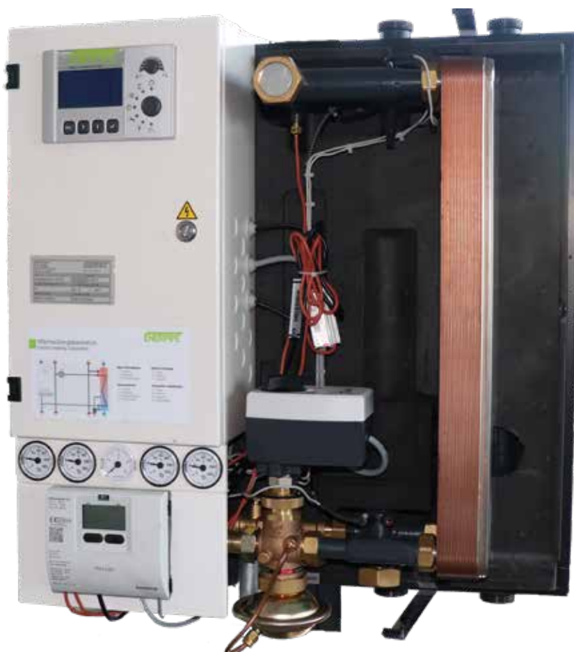
Übergabestation ohne Verkleidung

Bei diesem vollkommen neuen Konstruktionsprinzip ersetzt das Sandwichgehäuse den herkömmlichen Trägerrahmen. Wärmedämmung, Komponentenfixierung und Wandhalterung verschmelzen zu einer Einheit. Die Anlagen sind äußerst kompakt und leicht, mechanisch stabil und bestechen durch einfaches Handling. Alle Komponenten sind nach Abnahme des vorderen Gehäuseteils frei zugänglich.