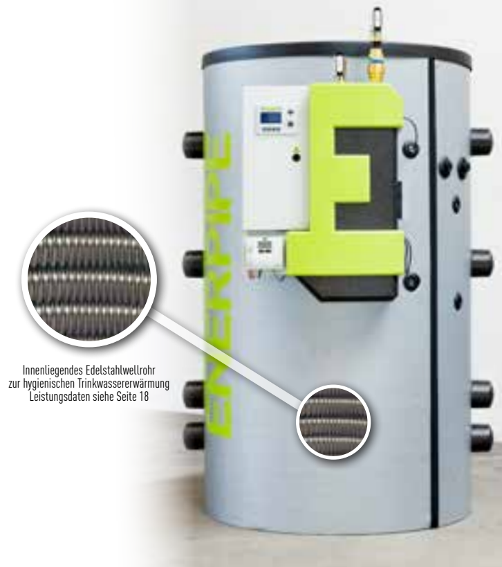
Innenliegendes Edelstahlwellrohr zur hygienischen Trinkwassererwärmung Leistungsdaten siehe Seite 18